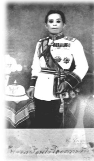
ภาพถ่าย เจ้าหลวงจักรคำขจรศักดิ์ เจ้าผู้ครองนครลำพูนองค์สุดท้าย

ภาพถ่ายเขียนไว้ว่า "ให้ยอดเรือนไว้ด้วยความรัก ๑๓/๑๑/๖๖"