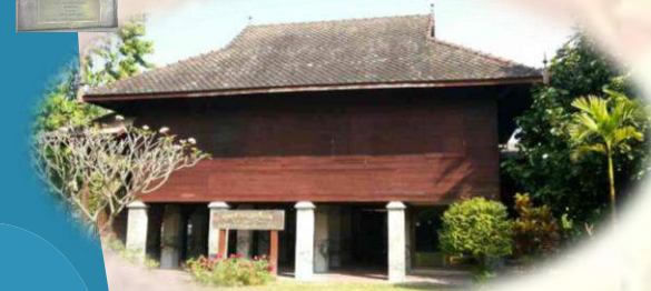
เทศบาลเมืองลำพูน