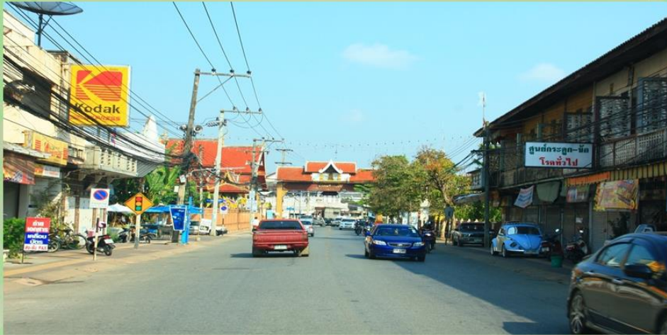
ภาพก่อนติดตั้งเสาไฟฟ้าแสงสว่าง