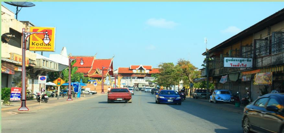
ภาพหลังติดตั้งเสาไฟฟ้าแสงสว่าง